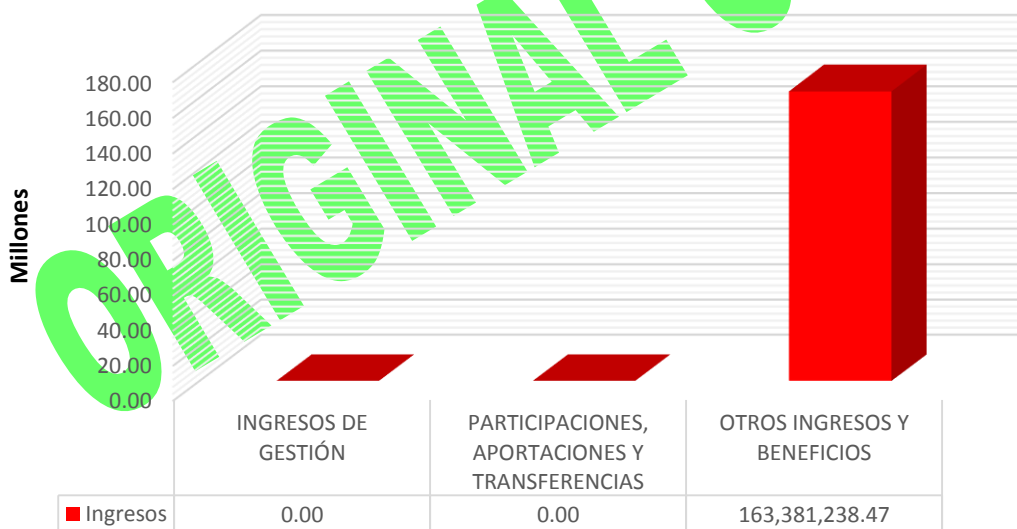
GRÁFICA 1 INGRESOS

Fuente: Estado de Actividades y documentación presentada por la Secretaría de Desarrollo Económico y Portuario.